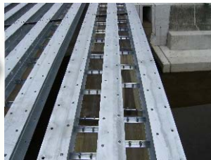
桁下面型枠設置状況