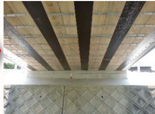
桁下面型枠設置状況