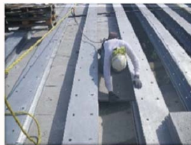
桁下面型枠設置状況