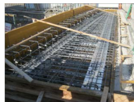
桁上面鉄筋組立状況