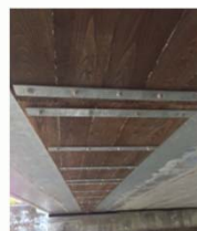
桁下面型枠設置状況