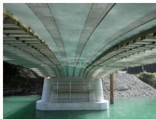
桁下面型枠設置状況