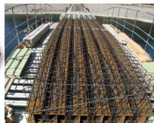
桁上面鉄筋組立状況