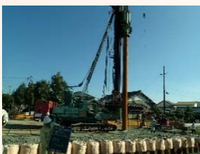
基礎杭の打設状況