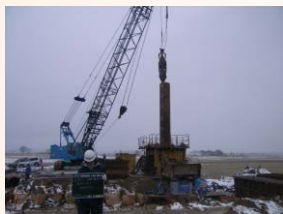
基礎杭の打設状況