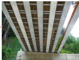
桁下面型枠設置状況