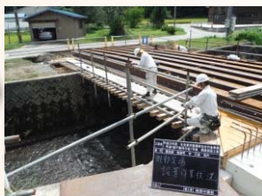
側部足場組立状況