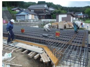
桁上面鉄筋組立状況