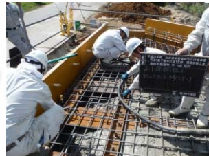
上下部連結金物取付状況