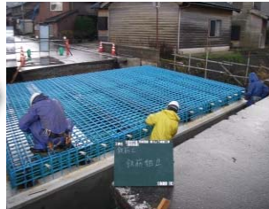
桁上面鉄筋組立状況