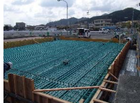
桁上面鉄筋組立完了