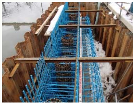
橋台鉄筋組立完了