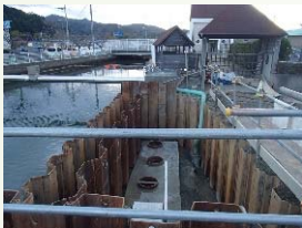
基礎杭の打設完了