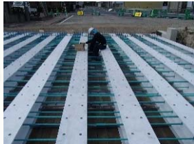
桁下面型枠設置完了