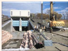
基礎杭の打設状況