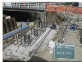
橋台鉄筋組立状況