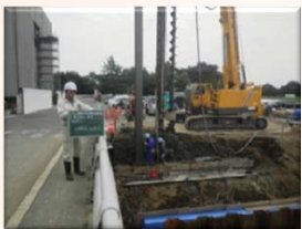
基礎杭の打設状況