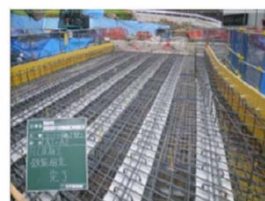
桁上面鉄筋組立状況