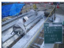
桁下面型枠設置状況