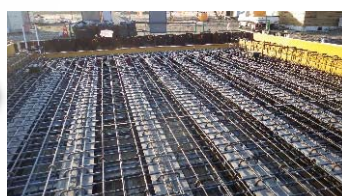
桁上面鉄筋組立状況