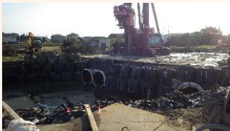
基礎杭の打設状況