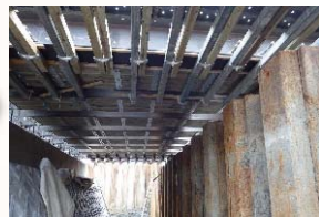
桁下面型枠設置状況