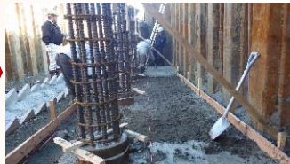
橋台基礎鉄筋組立状況