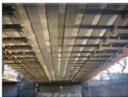
桁下面型枠設置状況