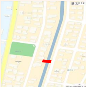
山形県酒田市錦町四丁目地内 外