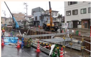
基礎杭の打設状況