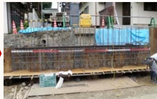
橋台鉄筋組立状況