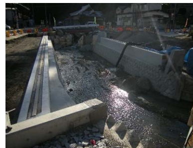
施工前(Before) 側面(下流より)