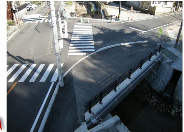
完成(After) 側面(下流より)