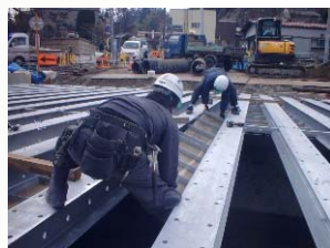
桁下面型枠設置状況