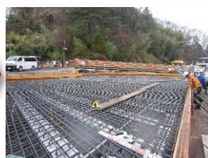
桁上面鉄筋組立状況