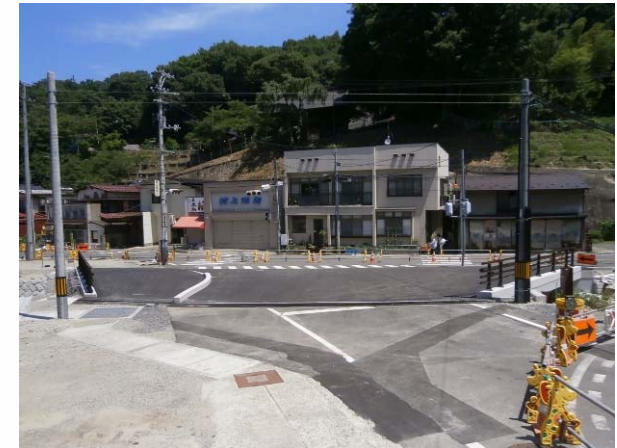
完成(After) 正面(左岸より)