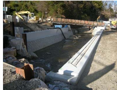
施工前(Before) 側面(上流より)