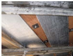
桁下面型枠設置状況