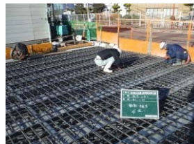
桁上面鉄筋組立状況