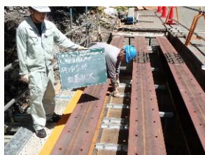
桁下面型枠設置状況