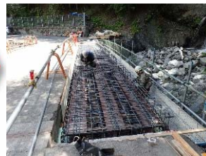
桁上面鉄筋組立状況