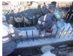
ポリマーモルタル塗布状況