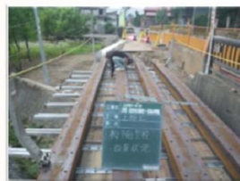
桁下面型枠設置状況