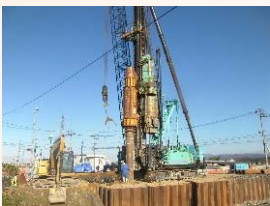
基礎杭の打設状況