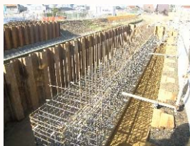
橋台鉄筋組立状況