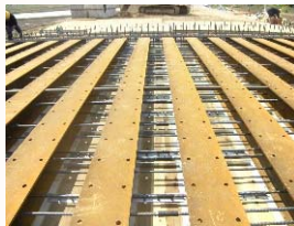
桁下面型枠設置状況