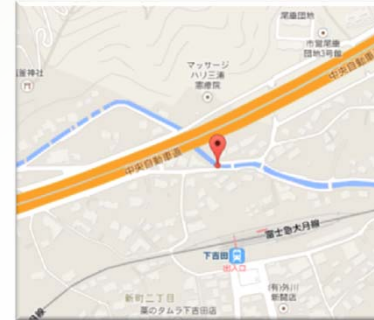
現場住所(路線名) 山梨県富士吉田市新倉