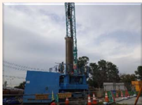
基礎杭の打設状況