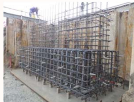
橋台鉄筋組立状況