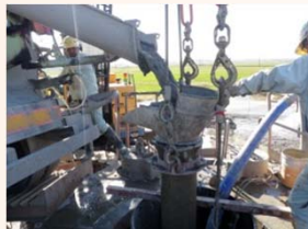
基礎杭の打設状況